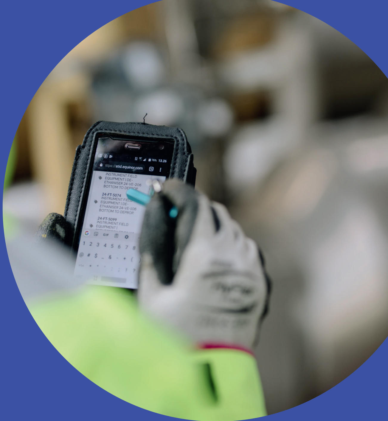
Digital field worker.