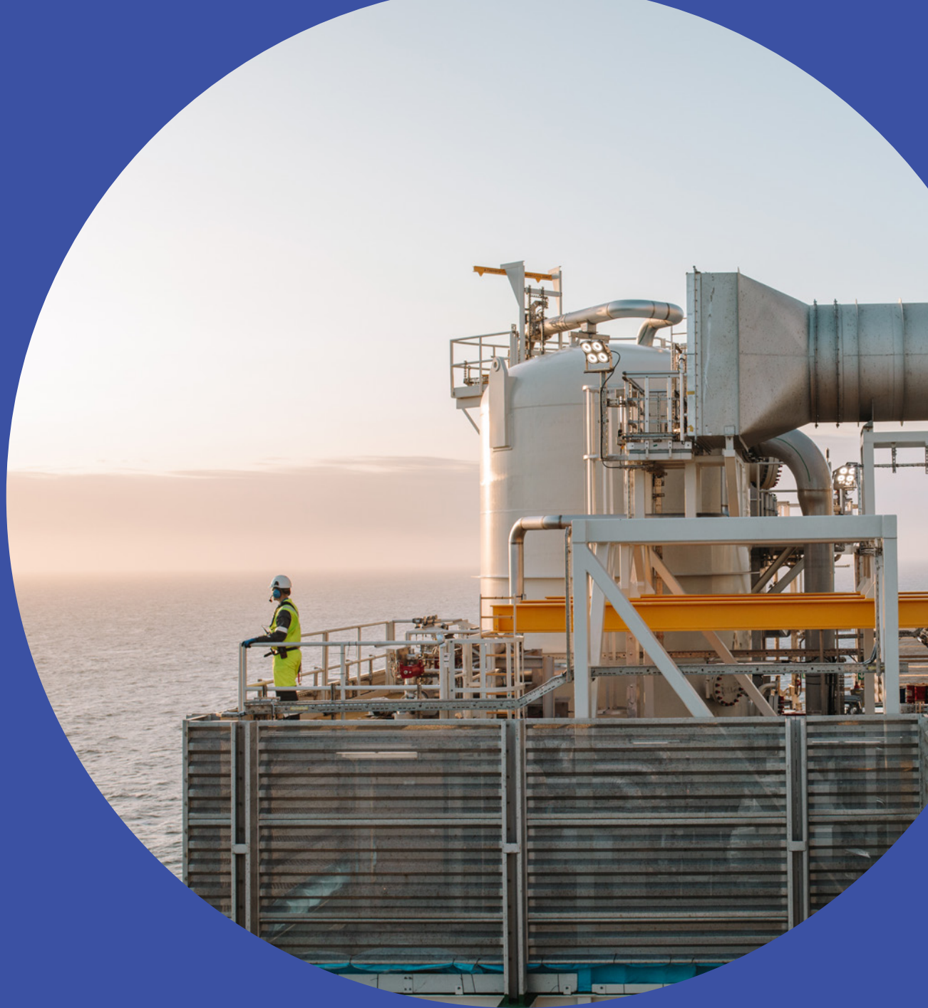
Johan Sverdrup.